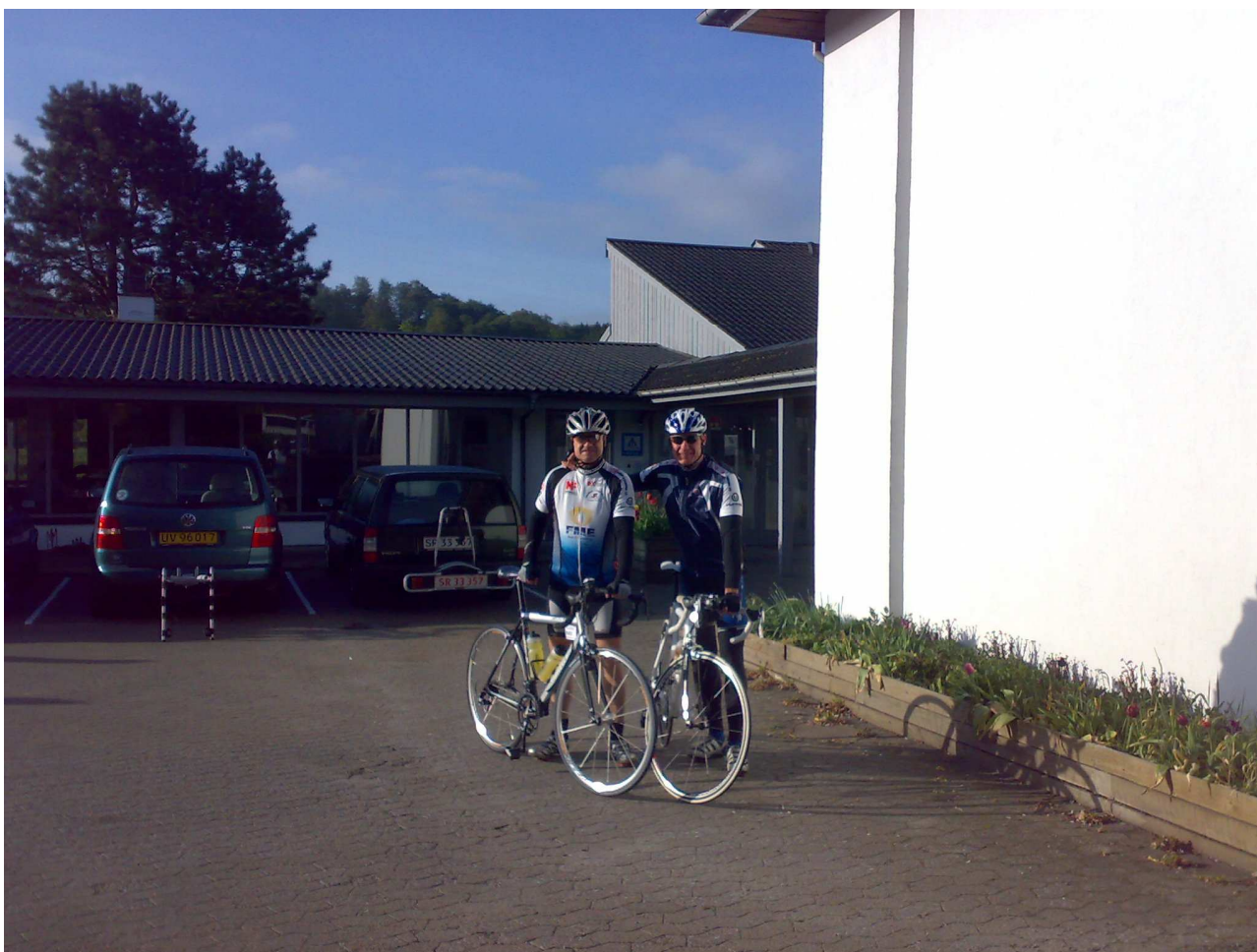
Officielt Holdbillede af Team Televom 2009 (sidste mand er fotografen)

Vejrudsigten lovede fint vejr, lidt vind men tørt og det holdte dog mener jeg at det blæste meget op sidst på dagen og det var lige meget hvilken retning vi kørte så var op mod vinden !!! Starten gik for vores 200km folk kl 8.09 og for 173km ruten kl. 8.45 og her var jeg i blandt.